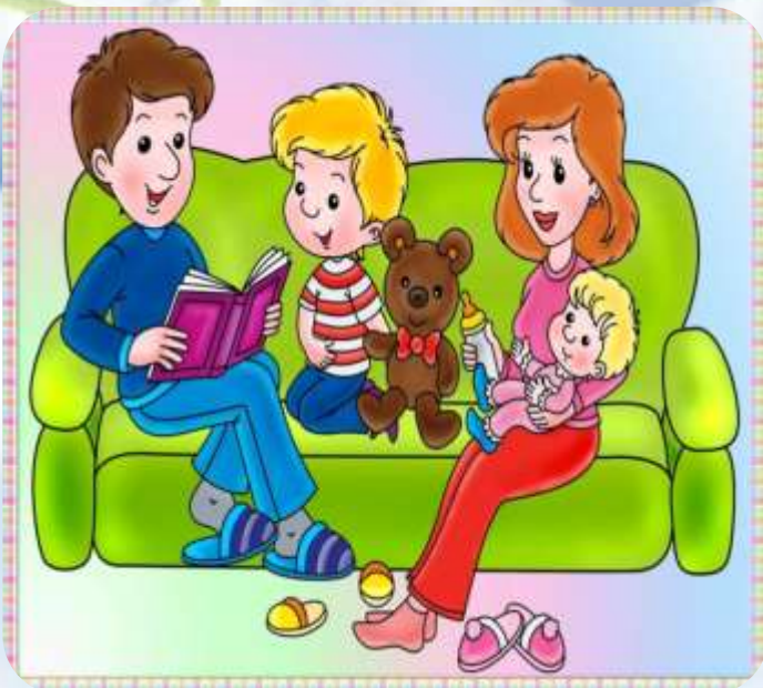
Мои братья и сестры