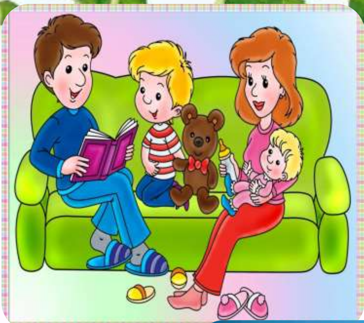
Мои братья и сестры